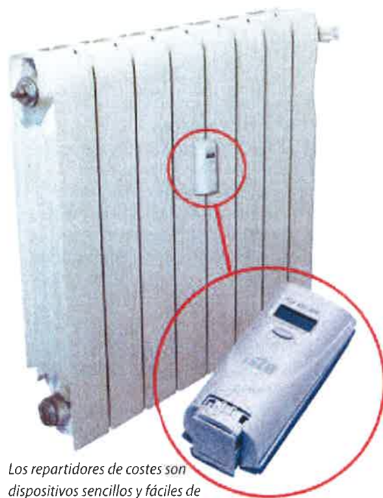
Los repartidores de costes son dispositivos sencillos y fáciles de instalar.

sólo instalando repartidores de costes de calefacción se pueden alcanzar ahorros sustanciales; y si además vienen acompañados con la instalación de válvulas termostáticas, que permitan que cada vecino regule su consumo, los ahorros pueden alcanzar hasta un 30% de la energía consumida en calefacción en el edificio.